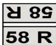
Plaques de cadre